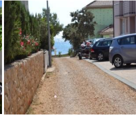
Oddaljenost od morja