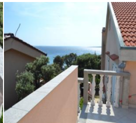
Terasa s pogledom na morje