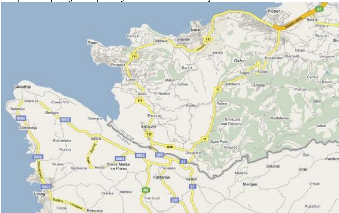
Zemljevid sporne meje vzdolž Dragonje (povzeto iz "GoogleMaps")

V Coni B STO pa so Hrvati, (ki so imeli veliko zaslonbo v Titu, saj jim je menda bil pripravljen dati vso Istro do Kopra), posegli ne samo po glavnih položajih v jugoslovanski vojaški upravi, ampak tudi po ključnih položajih na okrožnih komitejih.